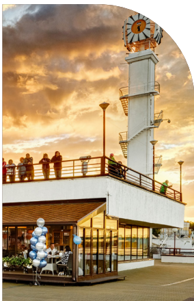
Видовой ресторан на берегу Волги